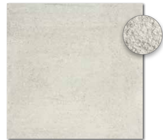
DAR63662 PEI 5 \odot 86 / m 2 mat | matt