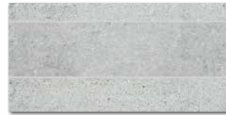
DDPSE661 PEI 5 ○ 68 / ks mat | matt