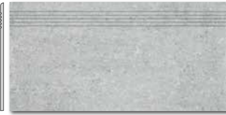
DCPSE661 PEI 5 ○ 72 / ks mat | matt