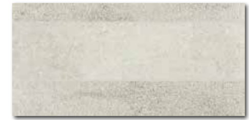
DDPSE662 PEI 5 ○ 68 / ks mat | matt