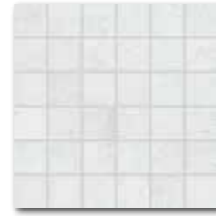
DDM06660 (SET) PEI 5 ○ 72 / set mat | matt