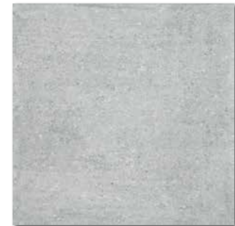
DAK63661 PEI 5 \odot 82 / m 2 mat | matt