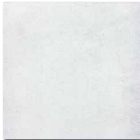
DAK63660 PEI 5 \odot 82 / m 2 mat | matt