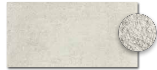
DARSE662 PEI 5 \odot 82 / m 2 mat | matt | R10 | B DAGSE662* news PEI 5 \odot 86 / m 2 mat | matt | R11 | C šedo-bežová / grey-beige / szara-bežowa / серый-бежевый / szürke-bézs