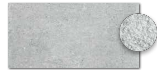
DARSE661 PEI 5 \odot 82 / m 2 mat | matt | R10 | B DAGSE661* news PEI 5 \odot 86 / m 2 mat | matt | R11 | C šedá / grey / szara / серый / szürke