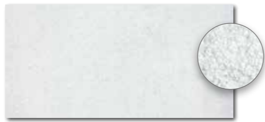
DARSE660 PEI 5 \odot 82 / m 2 mat | matt | R10 | B DAGSE660* news PEI 5 \odot 86 / m 2 mat | matt | R11 | C světle šedá / light grey / jasnoszara / светло-серый / világosszürke