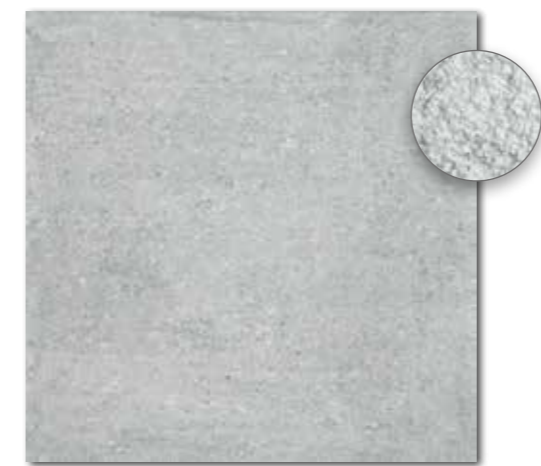
DAR63661 PEI 5 \odot 86 / m 2 mat | matt