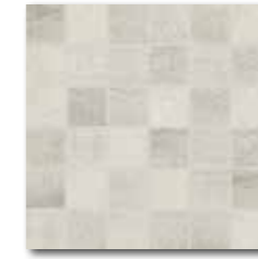
DDM06662 (SET) PEI 5 ○ 72 / set mat | matt