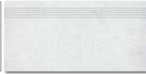
DCPSE660 PEI 5 ○ 72 / ks mat | matt