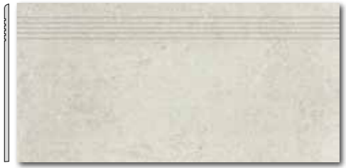
DCPSE662 PEI 5 ○ 72 / ks mat | matt