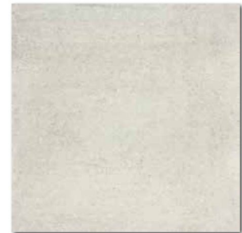
DAK63662 PEI 5 \odot 82 / m 2 mat | matt