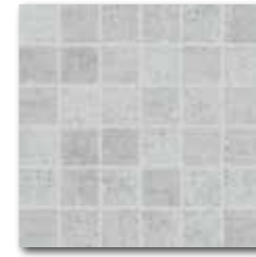
DDM06661 (SET) PEI 5 ○ 72 / set mat | matt