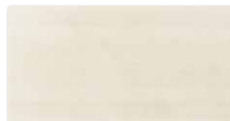
WARV4042 ○ 78 / m 2 mat | matt | ❄️ světle béžová / light beige / jasno-bežowa светло-бежевый / világosbézs