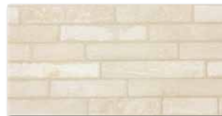
DARSE688 Brickstone PEI 4 ○ 78 / m 2 mat | matt světle béžová / light beige / jasno-beżowa светло-бежевый / világosbézs Dorogučená spráovací hmota RAKO SYSTEM GF DRY 121 (manhattan) Recommended grout RAKO SYSTEM GF DRY 121 (manhattan)