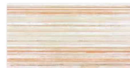
WITV4005 ○ 82 / ks mat | matt béžovo-oranžová / beige-orange / beżowo-pomarańczowy бежево-оранжевый / bézs-páncs