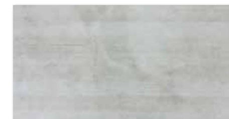
WARV4041 ○ 78 / m 2 mat | matt | ❄️

světle šedá / light grey / jasnoszara светло-серый / világosszürke