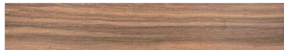
DAKVG143 Board PEI 4 ○ 98 / m 2 mat | matt

Doporučená spárovací hmota RAKO SYSTEM GF DRY 121 (manhattan) Recommended grout RAKO SYSTEM GF DRY 121 (manhattan)