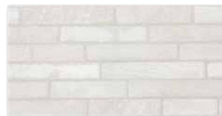
DARSE687 Brickstone PEI 4 ○ 78 / m 2 mat | matt

světle šedá / light grey / jasnoszara светло-серый / világosszürke