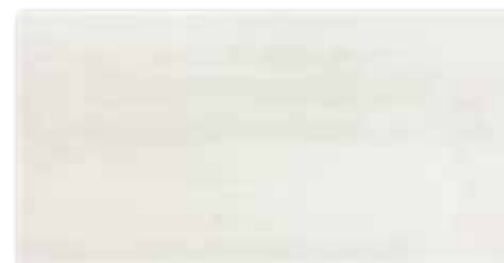
WARV4040 ○ 78 / m 2 mat | matt | ❄️

světle šedá / light grey / jasnoszara светло-серый / világosszürke