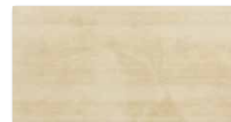
WARV4043 ○ 78 / m 2 mat | matt | ❄️ béžová / beige / beżowa / бежевый / bézs