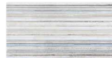
WITV4004 ○ 82 / ks mat | matt

šedomodrá / grey-blue / szaro-niebieska sero-goluboy / szürke-kék